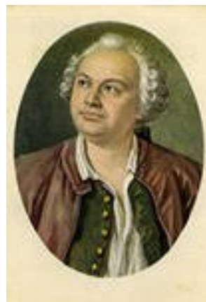
М.В. Ломоносов (8 ноября 1711 - 4 апреля 1765)